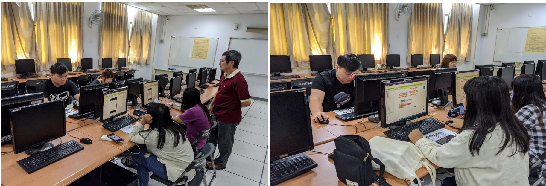
學生學習製作生活 App