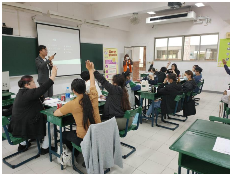
學生參加勞動力發展署講師就業職涯面面觀