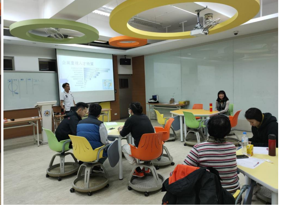
學生參加傑出校友返校演講生涯規劃