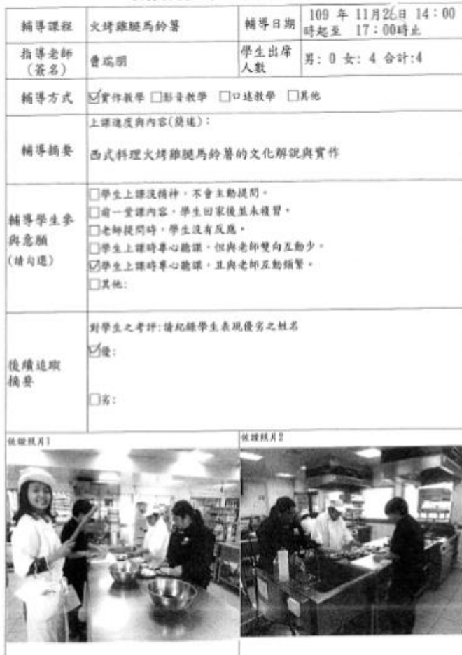
學生參加課業輔導學習烹飪技能