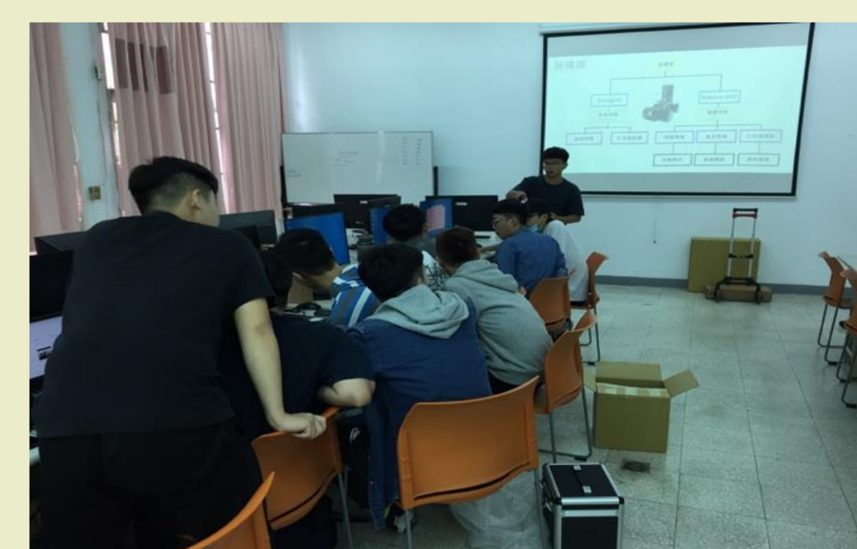
教材,教具與教師支援