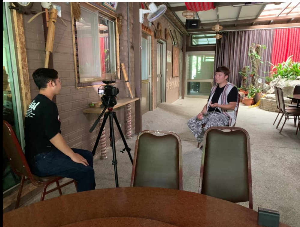
👉照片說明：部落客心得分享