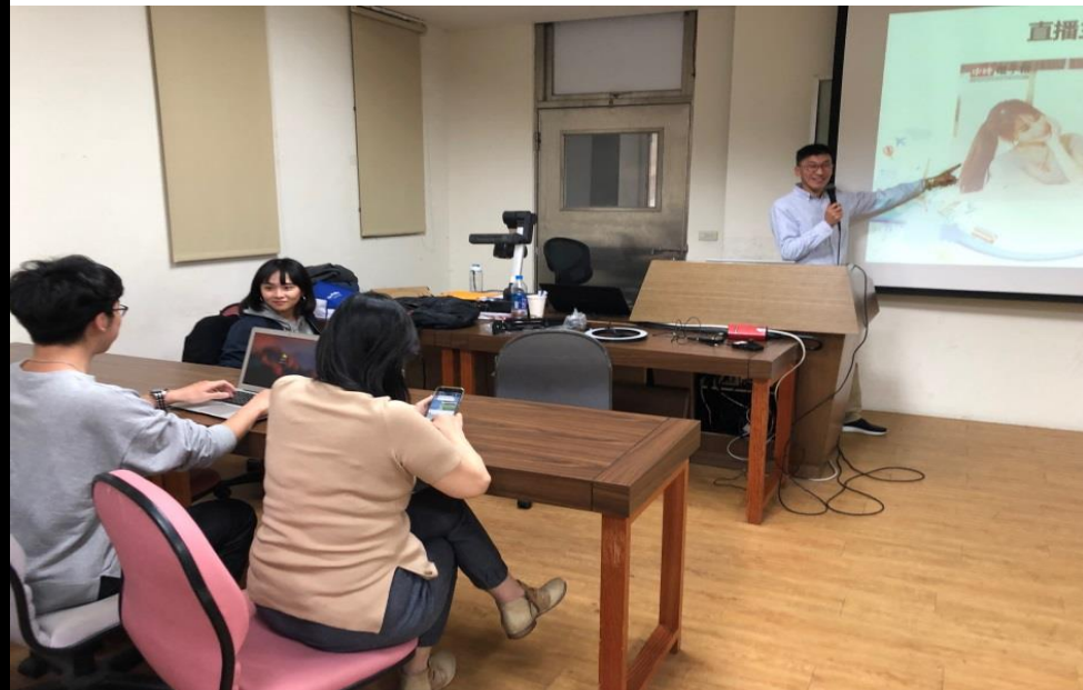
👉照片說明：直播注意事項