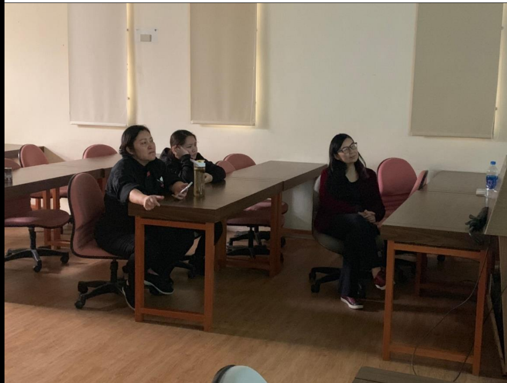
👉照片說明：聆聽上課