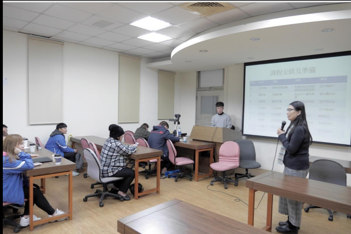
👉照片說明：介紹課程與安排