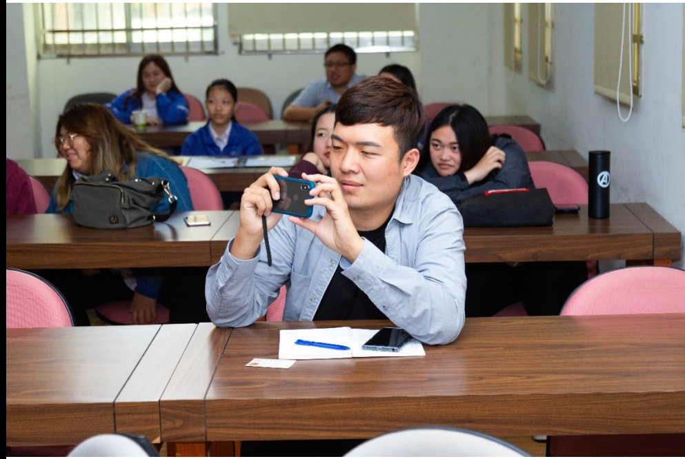
👉照片說明：錄影學習