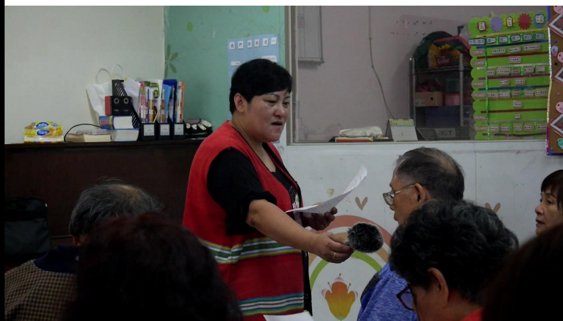
👉照片說明：獨唱聖歌