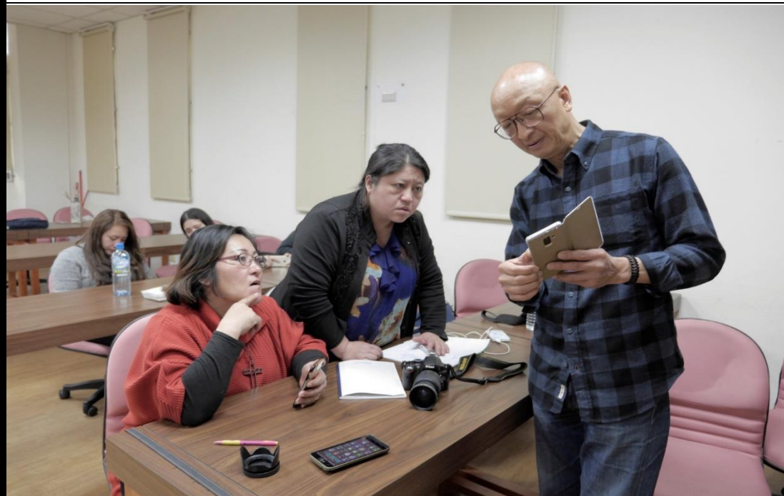
👉照片說明：介紹手機如何拍出好照片