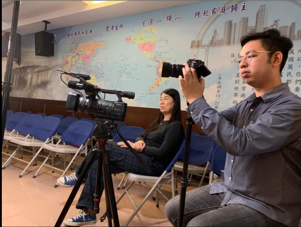
📌照片說明：設備架設