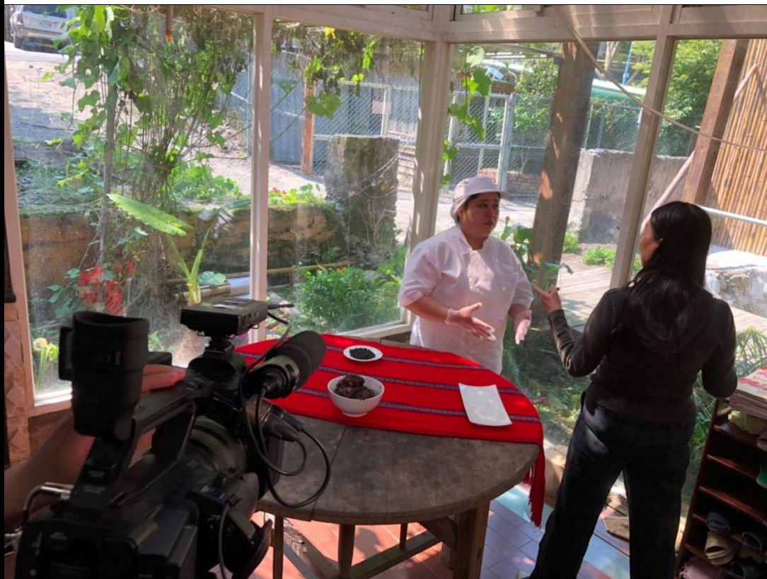
👉照片說明：拍攝樹豆豬腳