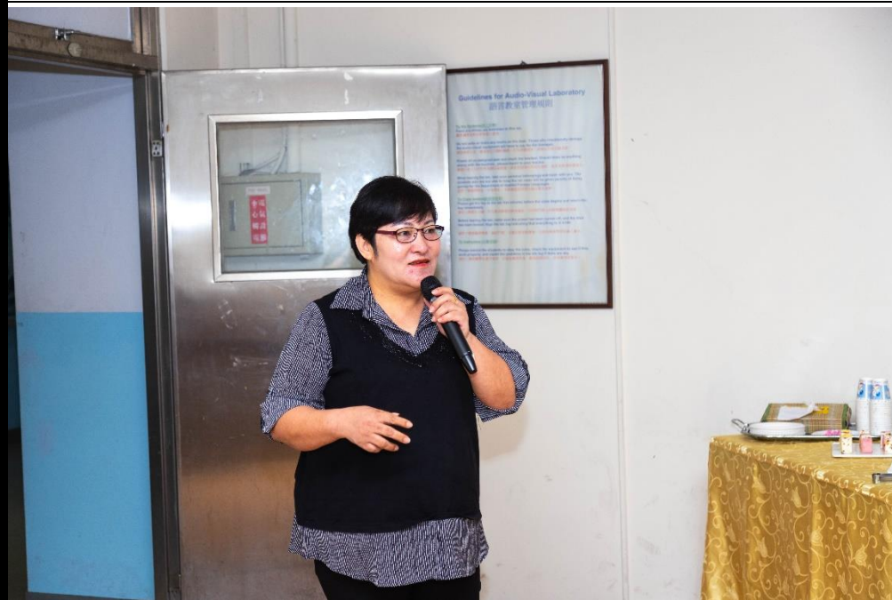
👉照片說明：上台發表心得