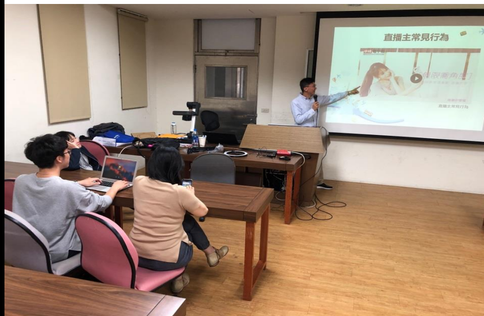
👉照片說明：直播注意事項