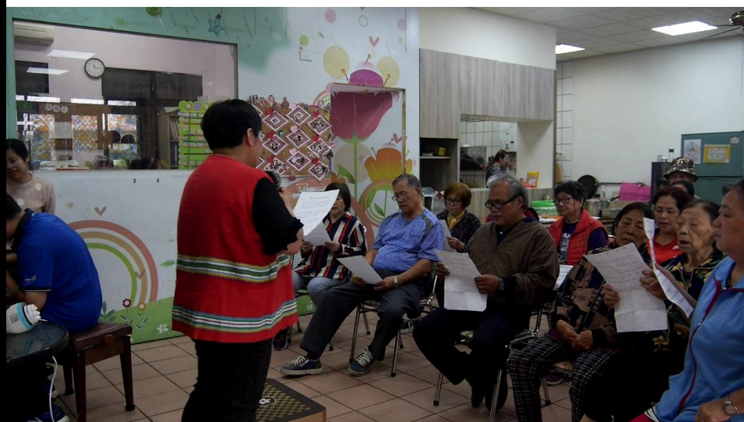
👉照片說明：聖歌合唱