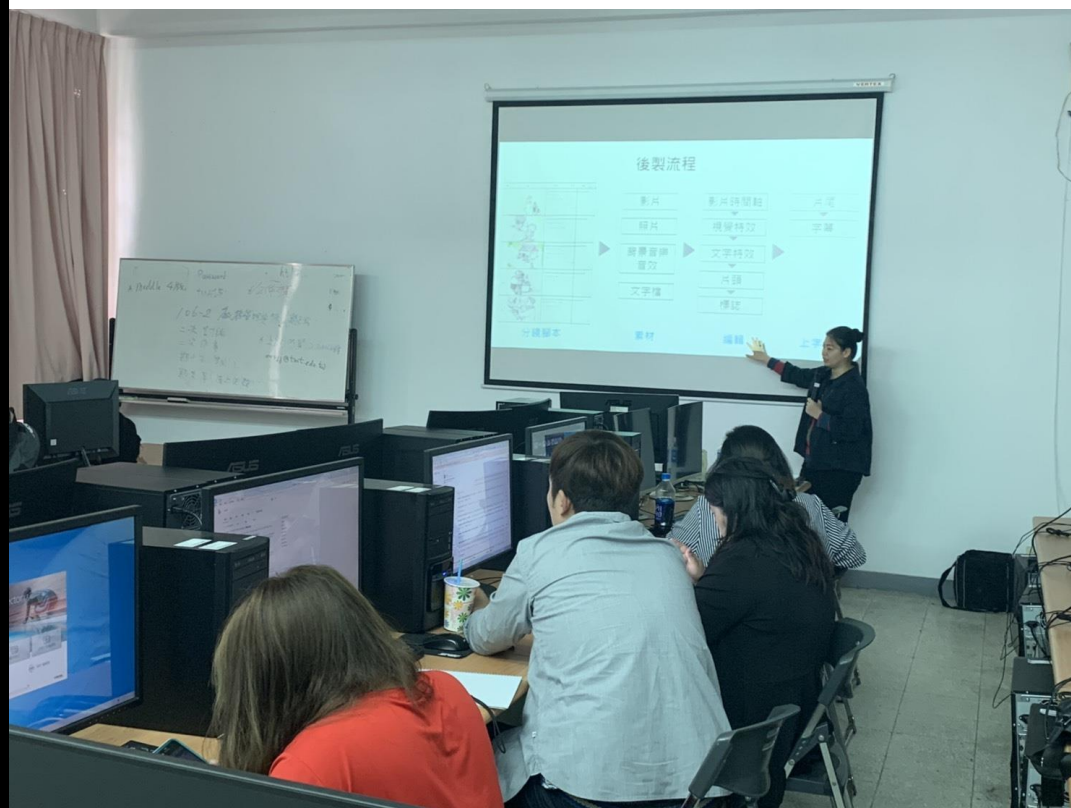
📌照片說明：編輯影片的注意事項