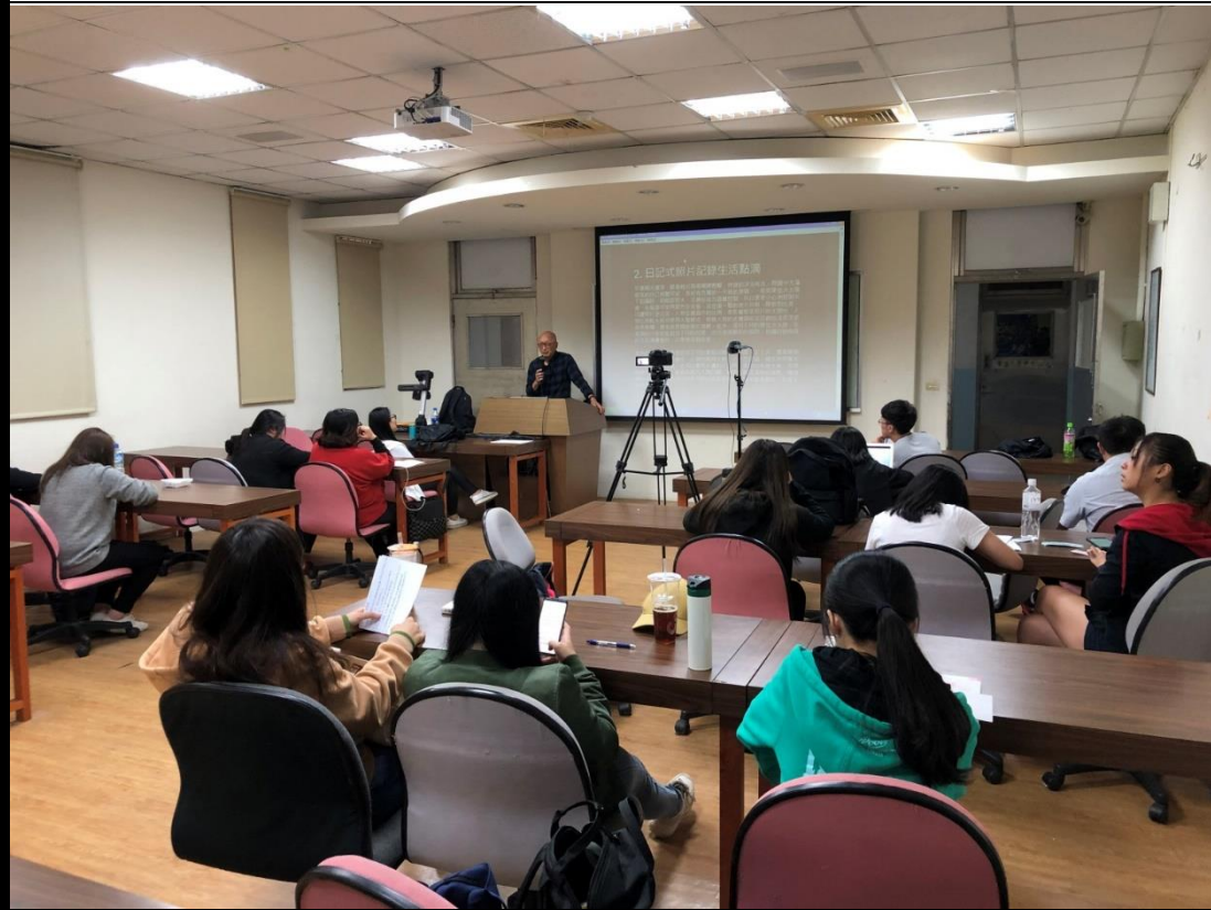
👉照片說明：日記式相片記錄生活點滴