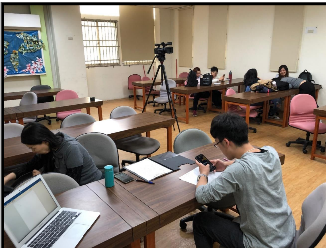
👉照片說明：設計拍攝影片腳本