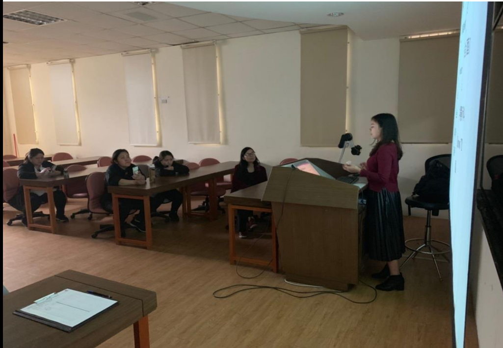
👉照片說明：網路平台之使用