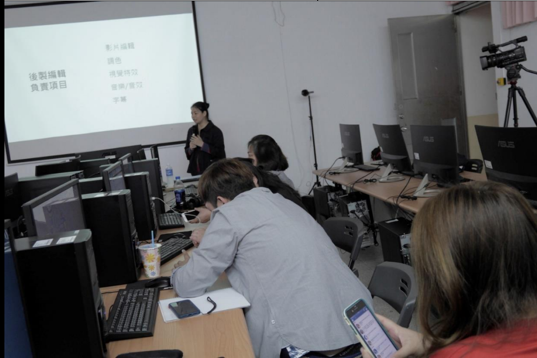
👉照片說明：介紹後期編輯項目