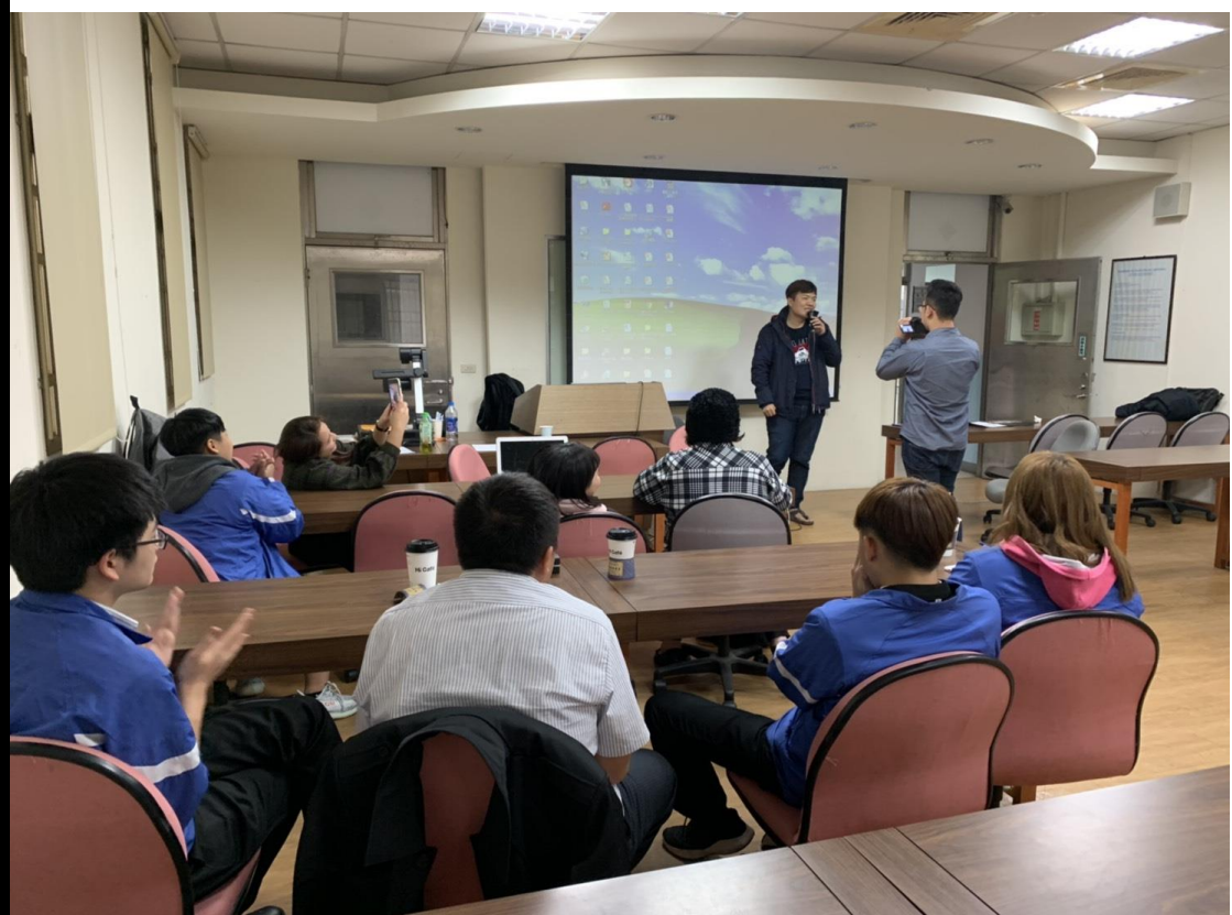
👉照片說明：了解原民歌曲