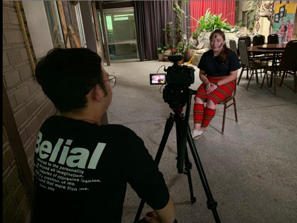
👉照片說明：族人故事分享