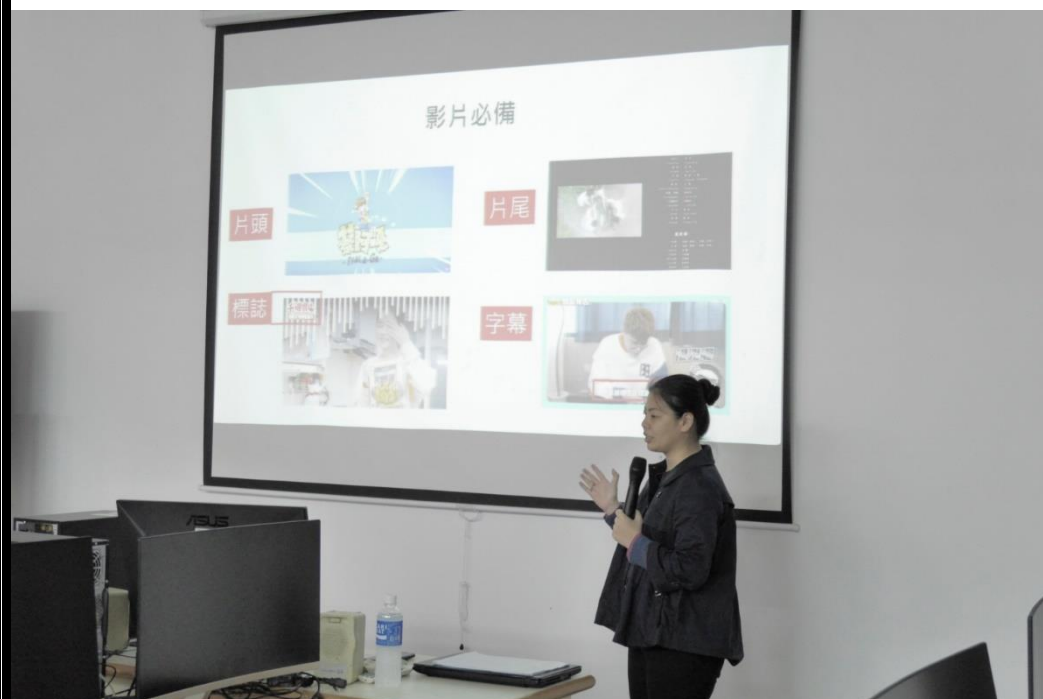
👉照片說明：介紹編輯影片必備項目