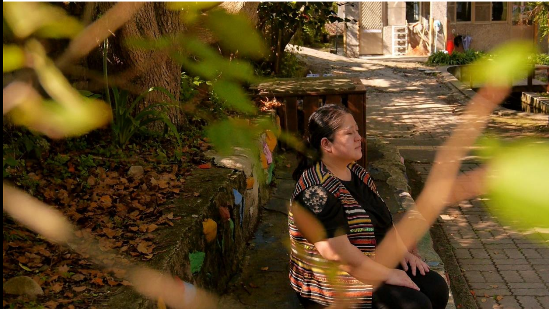
👉照片說明：影片側拍