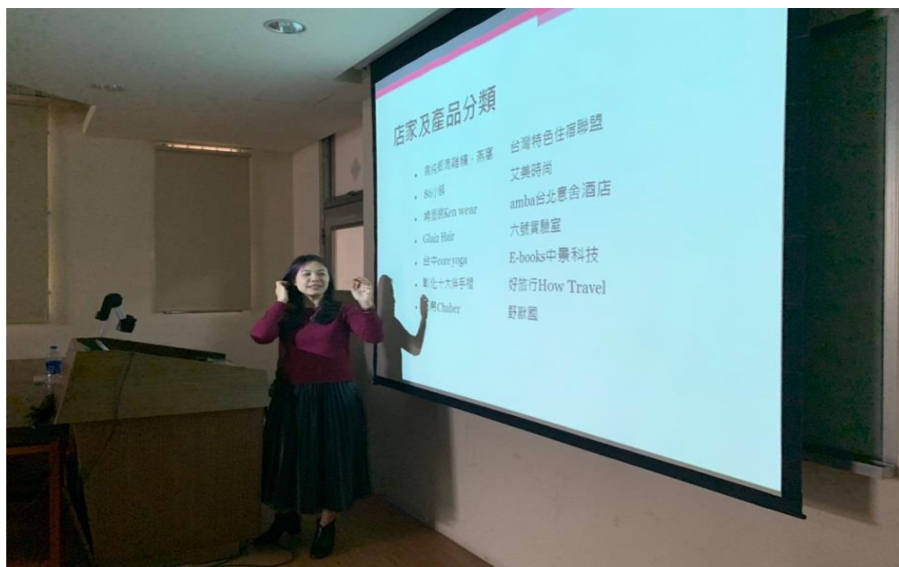
👉照片說明：產品種類分類