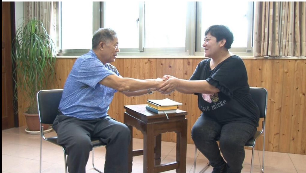
📌照片說明：長老給與部落客勉勵