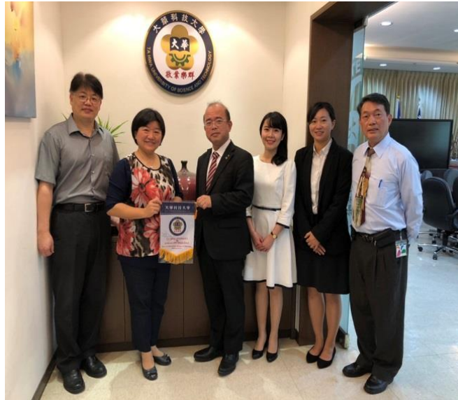
4. 與日本下館第一高校簽訂姐妹校合作關係