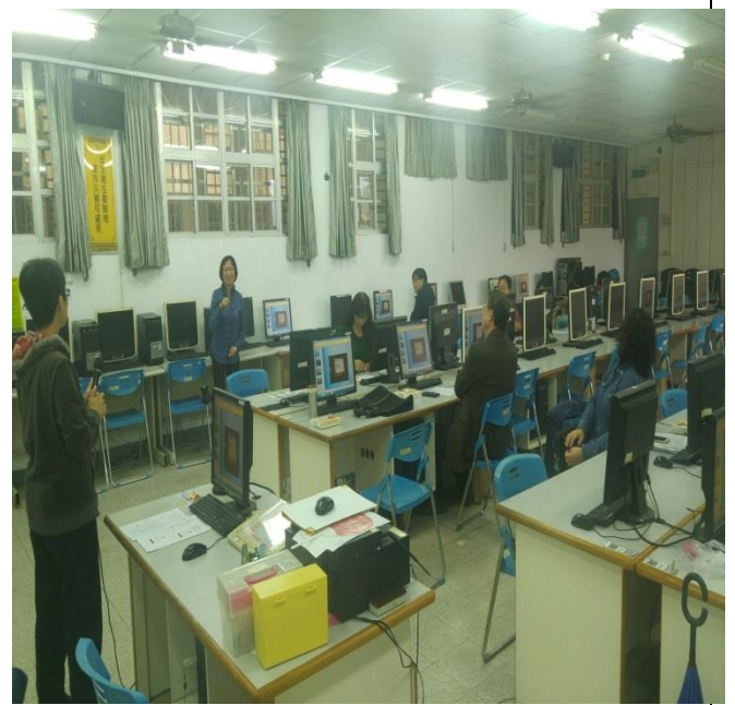
說明：教學實踐計畫研習