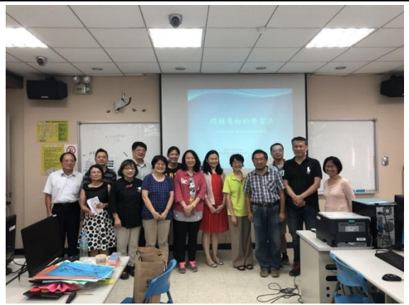
說明：PBL 教學技巧研習