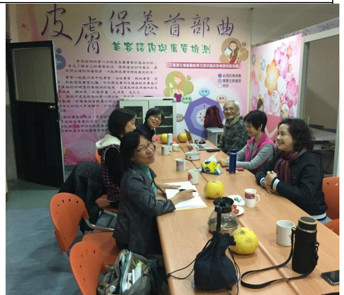
螢火微光讀書會交流 2