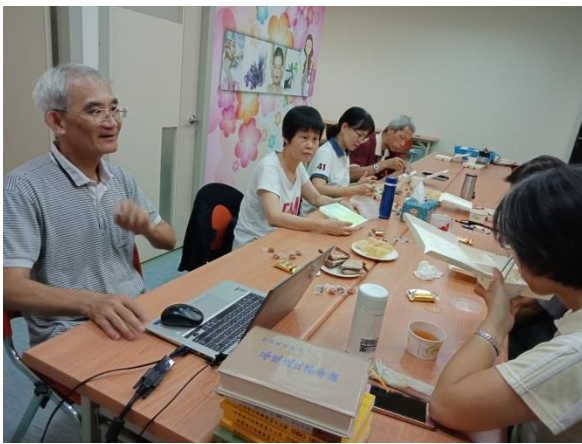
說明：螢火微光讀書會交流 1