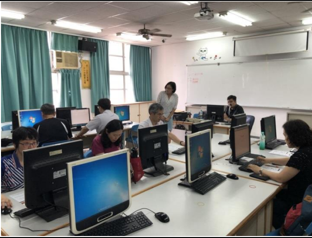
說明：1062 教師 Zuvio 研習