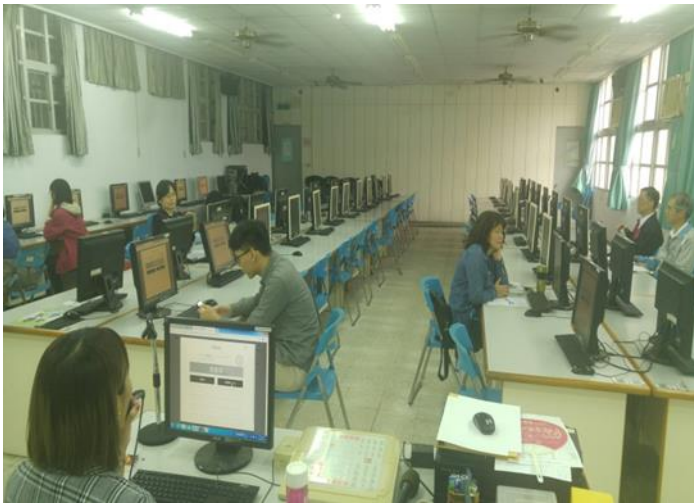
說明：1071 教師 Zuvio 研習