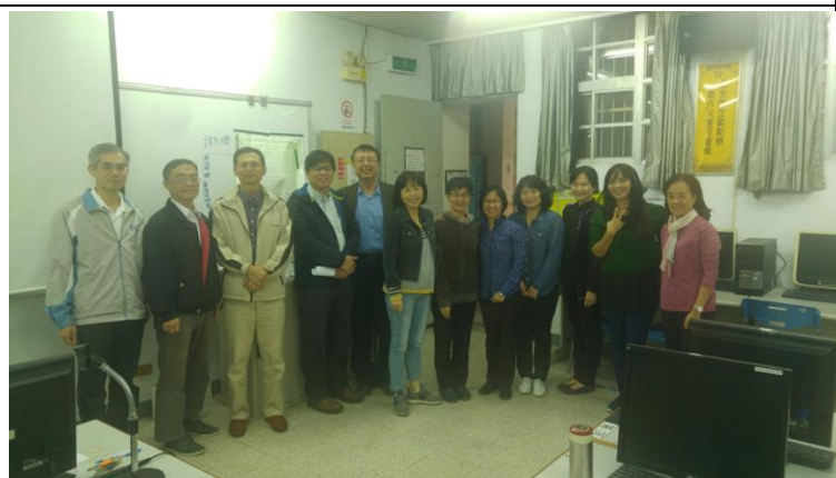
說明：教學實踐計畫研習