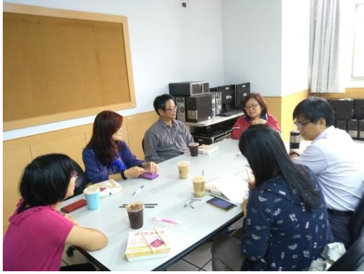
說明：教學實踐成長社群 1