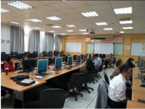
說明：教學實踐成長社群教師經驗分享