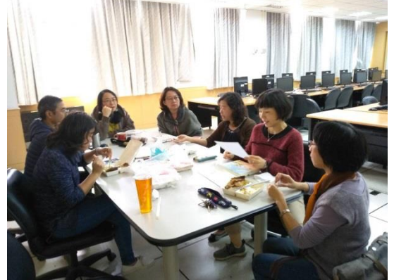
說明：教學實踐成長社群討論