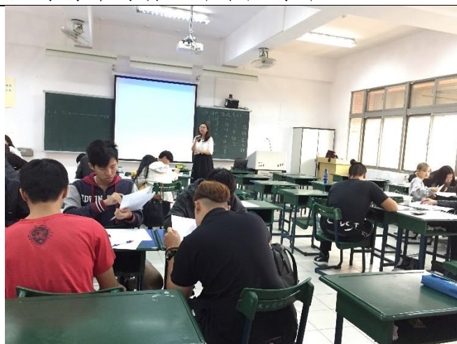
詩亞老師帶領學生作業練習