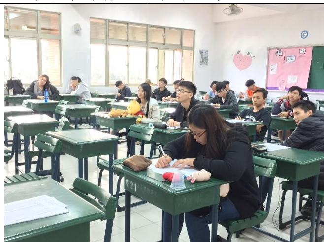
詩亞老師上課情形