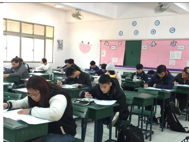
大一新生期末語文能力測驗