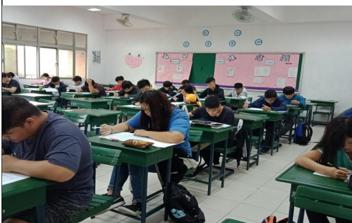
大一新生期初語文能力測驗