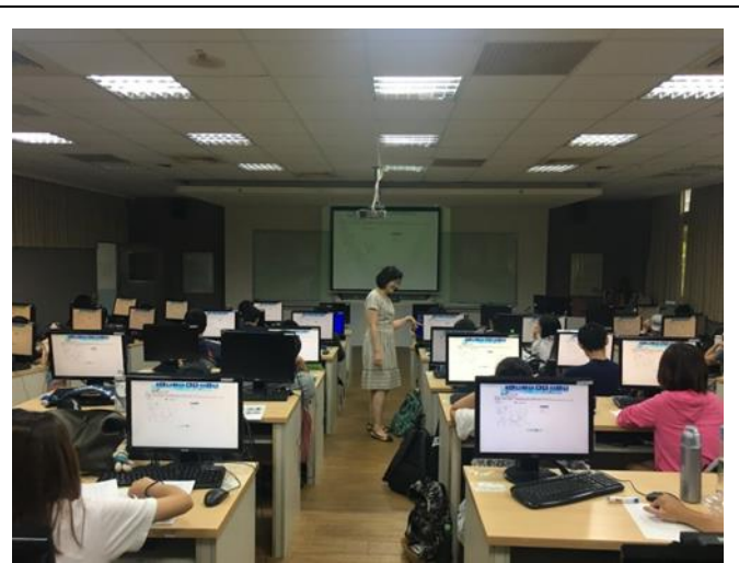
說明：全民英檢模擬測驗題型練習-圖片題看圖說話