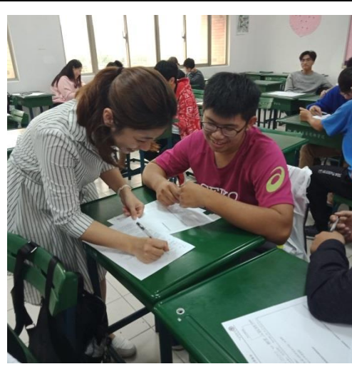
佳詩老師閱讀理解練習指導