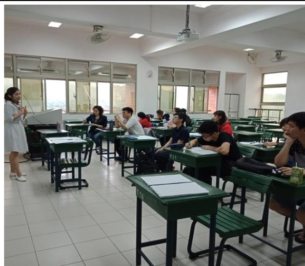
佳詩講師閱讀理解課程講解